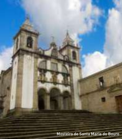
Mosteiro de Santa Maria do Bouro