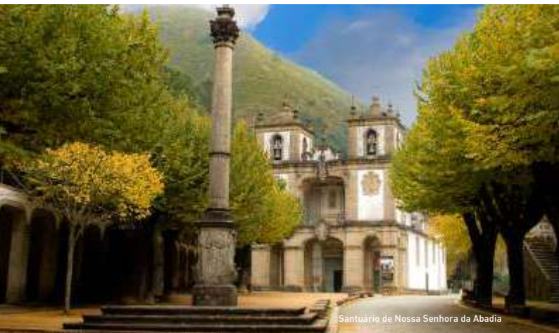
Santuário de Nossa Senhora da Abadia

Cerca de um quilómetro antes do Santuário da Abadia, avistam-se no percurso as capelas correspondentes aos caminhos da “Paixão de Cristo” e da “Vida de Maria”, popularmente conhecidas por “Calvários da Senhora da Abadia” ou “Os caminhos de Belém”. No total são 15 capelas, o percurso é consideravelmente recomendado para quem quer mergulhar no silêncio da montanha, embalado pelo chilrear dos pássaros, e pelo marulhar das águas, que são uma marca ininterrupta em toda a envolvente da Abadia.