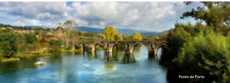
Ponte do Porto

Atualmente a Ponte do Porto, que faz a ligação entre o concelho de Amares e o concelho da Póvoa de Lanhoso, não tem circulação de trânsito, o que permite apreciar um dos mais belos quadros do concelho de Amares.