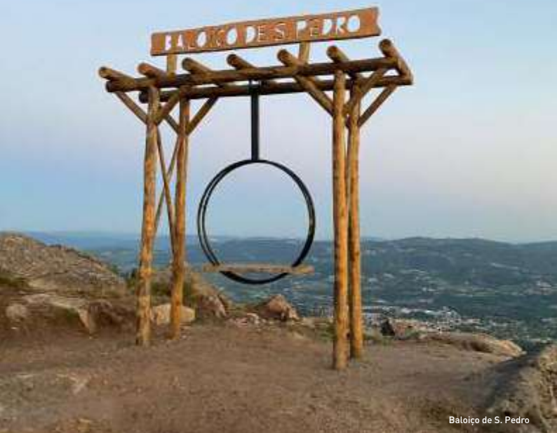
Baloiço de S. Pedro