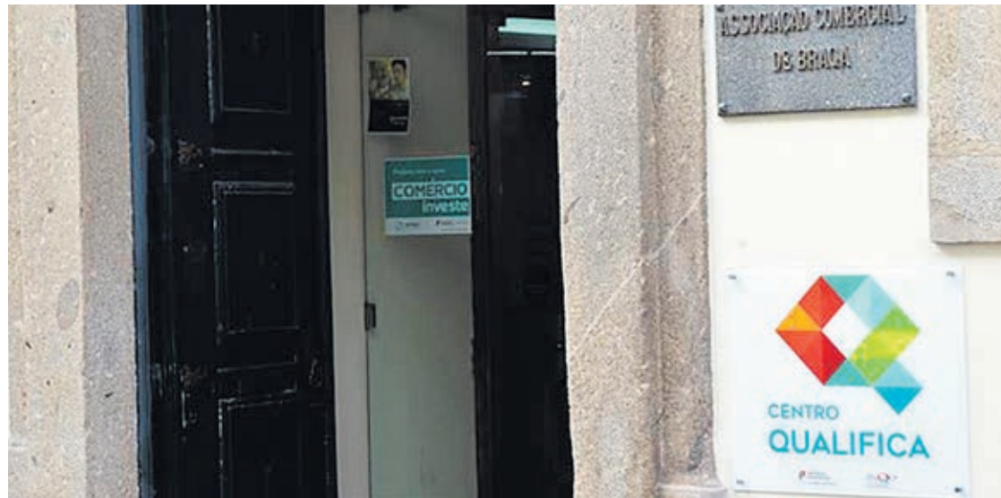
Centro Qualifica da Associação Comercial de Braga

O Centro Qualifica da ACB está a receber inscrições de profissionais de cozinha/pastelaria interessados em certificar os seus conhecimentos e competências.