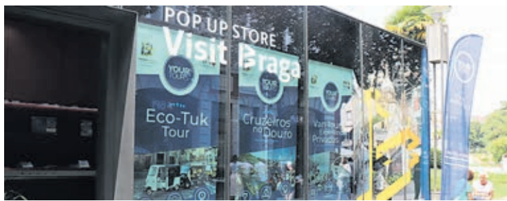
Pop Up Store no centro de Braga