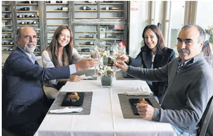
'Roteiro Verde Cool' dura até meados de Outubro