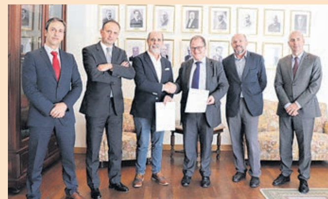
Responsáveis da ACB e do Millenium BCP celebram parceria

O Millenium bcp apoia os empreendedores com projetos de criação de microempresas ou autoemprego que sejam considerados viáveis, de forma expedita e tendo em atenção certas condições que podem ser consultadas no separador protocolos em www.acbraga.pt .