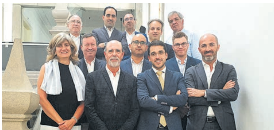
Dirigentes da ACB reuniram com Secretário de Estado da Defesa do Consumidor

Segundo o presidente da ACB, “é preciso ajustar o próximo programa de apoios para que o comércio tenha uma representatividade consentânea com o seu real pe-