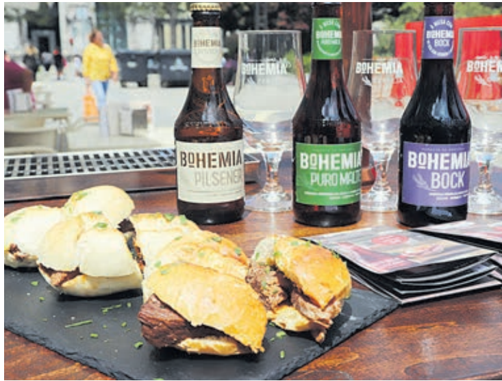
'Petiscar à la Bohemia' em 21 estabelecimentos

A ACB espera que, durante os 17 dias da promoção, sejam servidos mais de 15 mil menus.