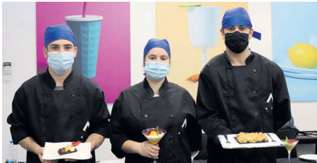
Formação ministrada pela ACB revela altos índices de excelência e de empregabilidade

tiva experiente e altamente qualificada, e de instalações magníficas, a ACB tem vindo, ao longo dos anos, a afirmar-se localmente, revelando elevados índices de excelência e de empregabilidade, nas suas áreas de actuação.