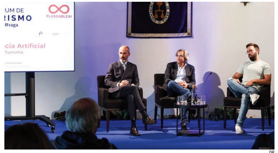
5.º Fórum de Turismo - Visit Braga decorreu no salão nobre da AEB

O 5.º Fórum de Turismo – Visit Braga consolidou-se como um espaço privilegiado de reflexão e partilha de ideias, reforçando o compromisso de Braga com o desenvolvimento sustentável e inovador do turismo. Neste contexto, a AEB continuará a promover iniciativas que incentivem a competitividade e a valorização da região enquanto destino turístico de excelência.