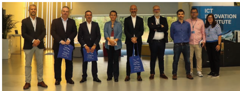
Comitiva da AEB visitou o CCG/ZGDV a 1 de outubro

O CCG é instituto de referência na investigação aplicada e na inovação tecnológica para a economia digital, e um parceiro de excelência das empresas, com quem a AEB integra dois consórcios com candidaturas apresen-