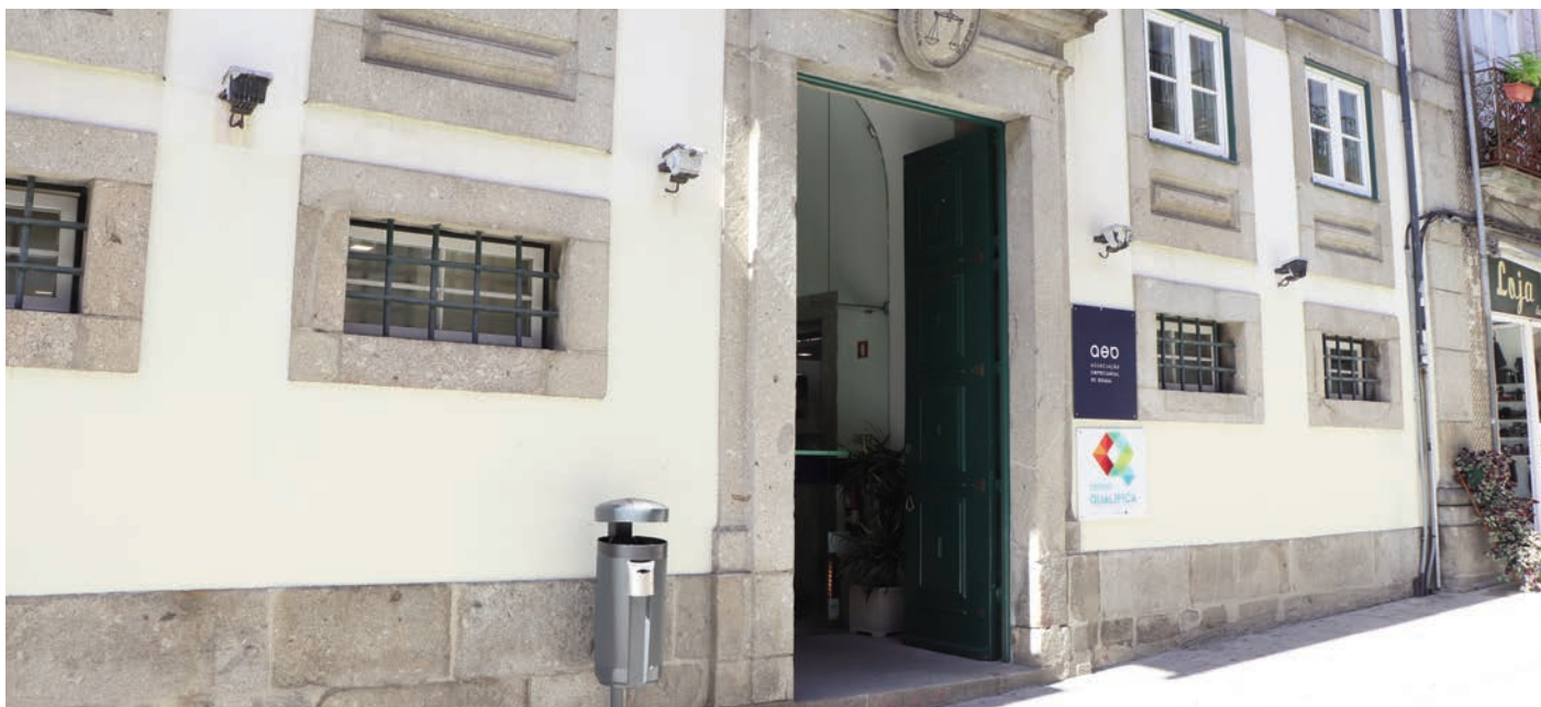
AEB está empenhada em promover a transformação digital

A Associação Empresarial de Braga (AEB) e o Instituto Politécnico do Cávado e do Ave (IPCA) lançaram o curso ‘Transformação Digital para Líderes’, dirigido a empresários e gestores de pequenas e médias empresas (PMEs). Esta formação, no âmbito do projeto Líder+ Digital, tem como objetivo dotar os participantes de competências estratégicas e práticas para implementar processos de transformação digital nas suas organizações.